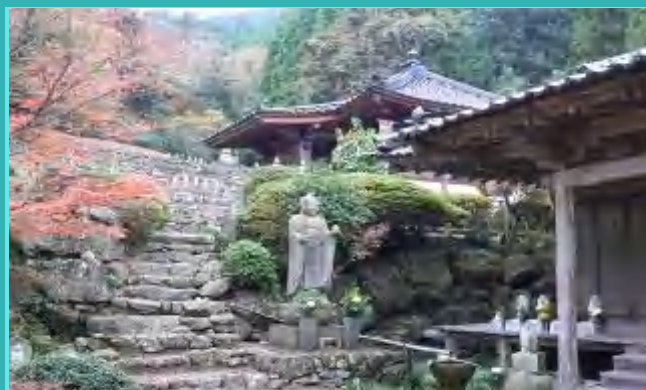
真言宗の古刹-神上寺