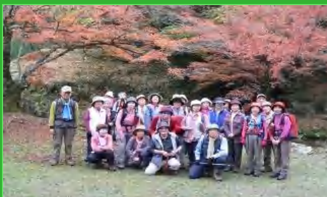
紅葉が美しい神上寺庭にて