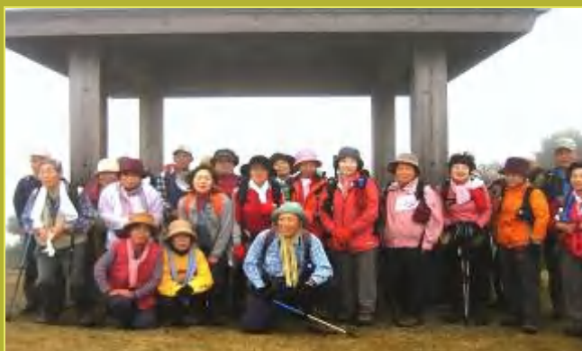
霧の華山頂上、華山登山より

❖ 11月24日(火)《♣》・西広島→神上寺登山口→中宮分岐→岩谷観音→華山頂上→中宮→神上寺下山→西広島 (参加者36名)